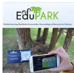
Fig.1 Exploração de conteúdos em Realidade Aumentada na App EduPARK.

Na lógica da promoção de estratégias que integram a investigação no processo de ensino e aprendizagem, o EduPARK tem vindo a unir esforços no sentido de envolver estudantes no projeto. Esta articulação constitui-se como uma relação de simbiose, em que ambas as partes beneficiam: i) o projeto beneficia dos contributos dos estudantes e ii) os estudantes beneficiam da oportunidade de se iniciarem na investigação.