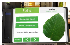
Fig.2 O utilizador pode rodar digitalmente e visualizar, em 3D, a página superior e inferior da folha.

O EduPARK recebeu, durante 6 meses, uma estudante do curso de Licenciatura em Ciências Exatas pelo Instituto de Física de São Carlos, da Universidade de São Paulo, Brasil, desenvolvendo um estágio no âmbito do Programa de Bolsas de Intercâmbio Internacional. Das várias tarefas em que colaborou com a equipa do EduPARK, destaca-se a integração da visualização de folhas de árvores, em 3D, nos conteúdos interativos da app (Fig.2). A estudante teve também a oportunidade de colaborar na escrita do seu primeiro artigo científico.